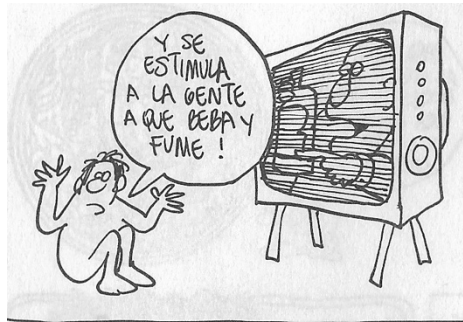
Figura 30. (24:61) cuadro 1

Para abordar esta crítica tenemos que entender que es una crítica indirecta al sistema capitalista, para los 60's la tv se estaba convirtiendo en un aparato común en los hogares de clase media, representaba que las familias ya tenían un buen nivel adquisitivo, también es importante resaltar que se estaba popularizando la televisión a color. Por esto algunas empresas empezaron a proyectar comerciales de sus mercancías, evidentemente no existía una regulación de contenidos en horarios y televidentes.