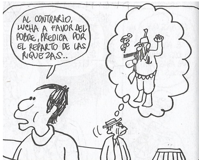
Figura 11. (18:102) cuadro 4

Lo que quería demostrar Rius entre líneas es que el candidato perfecto, debía tener rasgos que los candidatos del PRI no tenían, deja muy claro que debía ser un candidato de oposición y que no repitiera el mismo discurso oficial del partido Revolucionario, el candidato debía ser una persona humilde y cercano a la clase baja, se refiere a los Yanquis como enemigos obviamente los califica así desde una visión socialista, para Rius un buen gobierno era el que confrontaba a Estados Unidos por ser capitalistas, caso que no pasaba, puesto que en su momento Díaz Ordaz era muy cercano a Nixon, también remarca que el candidato tenía que estar limpio y no involucrado en casos de enriquecimiento personal, que no fuera un opresor y escuchara a los presos políticos, en los 60's tenían reclusos en Lecumberri presos políticos acusados por sus ideales comunistas sufrían de violaciones, injusticias, torturas, degradación, castigos y crueldad, como lo señala Carlos Monsiváis en su libro “Los mil y un velorios” .