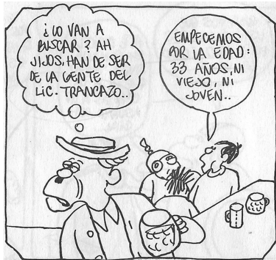
Figura 8. (18:100) cuadro 7