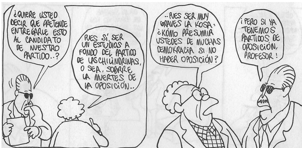
Figura 20. (39:232) cuadro 1 y 2

los cómputos, la prensa, la televisión”, en estas líneas Rius señala la hegemonía del ejecutivo, y respaldándose en el Profesor dice esto no es una democracia, esto tiene otro nombre, y sensato reconocer que el PRI en esta época fue una maquinaria política, sólida particular entre otras dictaduras que se vivían en América Latina pero como lo dijo Vargas Llosa esta es la “Dictadura perfecta”, la que se respalda en la mera simulación.