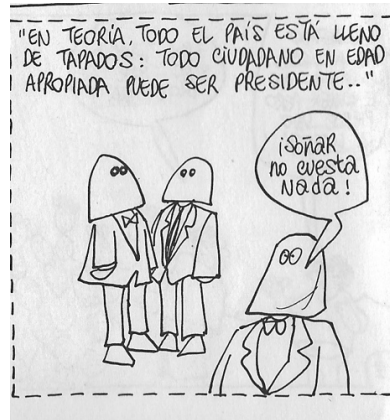
Figura 2. (02:10) cuadro 7

En la parte superior mediante una explicación alude a los contenidos constitucionales sobre los derechos de votar y ser votados y de ser candidato presidencial; “en teoría todo el país: todo ciudadano en edad apropiada puede ser presidente” (02:10). En el siguiente cuadro aparece un hombre con un cartel, con su cara que dice: “Pérez vote por él” (02:11), a un costado “y todos pueden presentar su candidatura para la presidencia, ¡somos un país libre!”; textualmente “pero por muy libres que seamos ya se nos ha quitado un poco lo tontos, así que nadie se lanza para presidente, si antes no lo destapan como al bueno” (02:11).