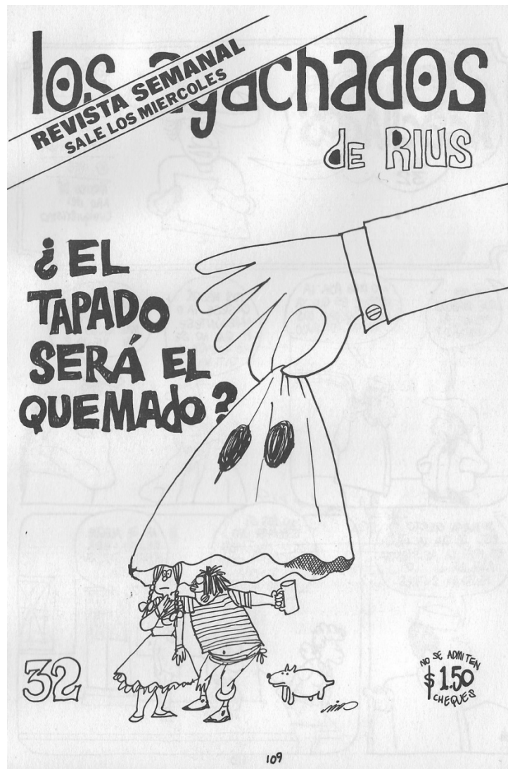
Figura 15. (18:109) portada

La novena crítica está en la historieta 32, Don Ruco: “soy viejo pero no estoy ciego ni sordo! ¿a poco cree que no me doy cuenta de lo que está pasando?, aunque Chayotitlán sea un corral 31 , las ideas se cuelan al estilo pulguita a brinco y brinco”. Gumaro: “¿cuáles ideas de qué habla?”. Don Ruco contesta: “¡no se haga que la virgen le habla, Gumaro! lo que está pasando es que el