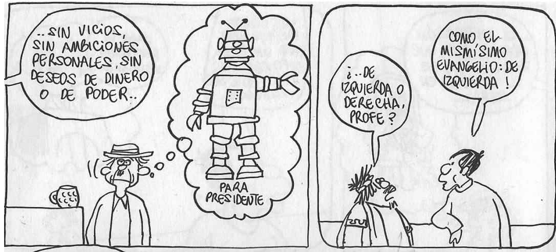
Figura 12. (18:102) cuadro 1y 2

Rius juega al ilustrar a Bedoyo enredado: “solo se imaginaba un robot” y es que el solo pensar quien cumple con esas características suena como una tomada de pelo ya que casi todos políticos tenían sus vicios y los que no, los mataban, Tobias le pregunta a Gumaro “de izquierda o derecha”, Gumaro contesta “como el mismísimo evangelio de izquierda”, este argumento es importante señalar ya que pierde objetividad la sátira Rius se inclina a ideología política, visiblemente a la izquierda, no es casual ya que es socialista y el discurso entre Tobias y Gumaro empieza a cobrar sentido e inclinar la balanza a un solo lado, Gumaro personaje que usa Rius para transmitir sus mensaje inmediatamente contesta “fíjense que en todas las palabras no hay una sola a favor de la explotación del hombre, ni de la propiedad privada, ni del derecho del fuerte sobre el débil”, “al contrario, lucha a favor del pobre, predica por el reparto de las riquezas”, en este punto podemos ver cómo contrasta los defectos del partido oficial y los capitalistas, proponiendo la ideología de izquierda como una solución viable y correcta.