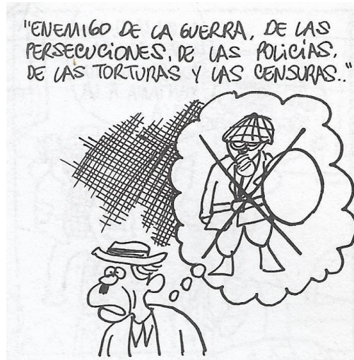
Figura 10. (18:103) cuadro 2

En la sexta crítica predomina la sátira, Rius se burla con ironía de Bedoyo Orejas personaje que representa un espía del PRI, Bedoyo se confunde al escuchar la plática entre Tobias y Gumaro, Tobias está buscando a la persona indicada para representar a Cristo en la crucifixión, Bedoyo piensa que buscan un candidato, preocupado exclama “han de ser la gente de el Lic. Trancazo”, haciendo referencia a Carlos Madrazo candidato de oposición que se perfilaba para la presidencia, años después lo mataron, Gumaro inicia a describir características del candidato; la edad de 33 años, aludiendo a Cristo, Bedoyo descarta a Fidel Velázquez sindicalista que duró muchos años en la política, Gumaro enfatizó que tenía que estar preparado para defenderse de sus enemigos, inmediatamente Bedoyo imagino un orador del RIP dando un discurso sobre los valores de la Revolución Mexicana, Gumaro seguía describiendo al candidato perfecto; de extracción de clase baja, que no se dejará ante sus enemigos, que no tuviera miedo a los ricos, que se acercara a los presos por sus ideales, sin vicios y ambiciones personales.