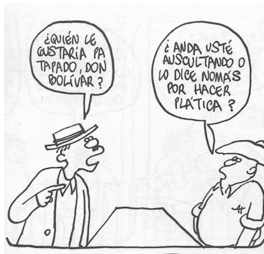
Figura 6. (18:83) cuadro 2