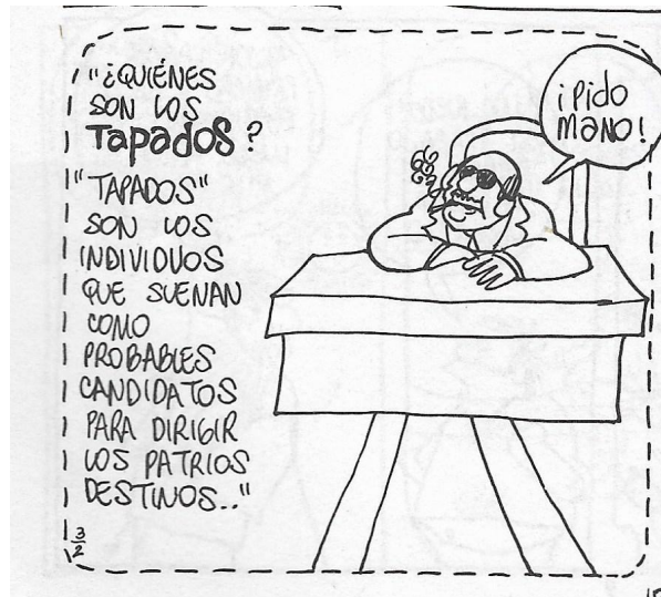
Figura 1. (2:10) cuadro 6

Rius ilustra el cuadro con el estereotipo del cacique o político provinciano “omnipotente” de la época porfirista: calvo, bigote poblado y recortado, lentes oscuros y sentado en un sillón ejecutivo, detrás de un gran escritorio. El hombre fuma un puro y dice: “¡pido mano!”. A un costado, el autor pone textualmente: “¿quiénes son los tapados? ‘tapados’ son los individuos que sueñan como probables candidatos para dirigir los patrios destinos” (02:10), donde los “patrios destinos” también equivale a una ironía, referida al país. En el siguiente cuadro pone tres sujetos que visten con traje y tienen una capucha; uno dice: “¡soñar no cuesta nada!”, refrán muy popular.