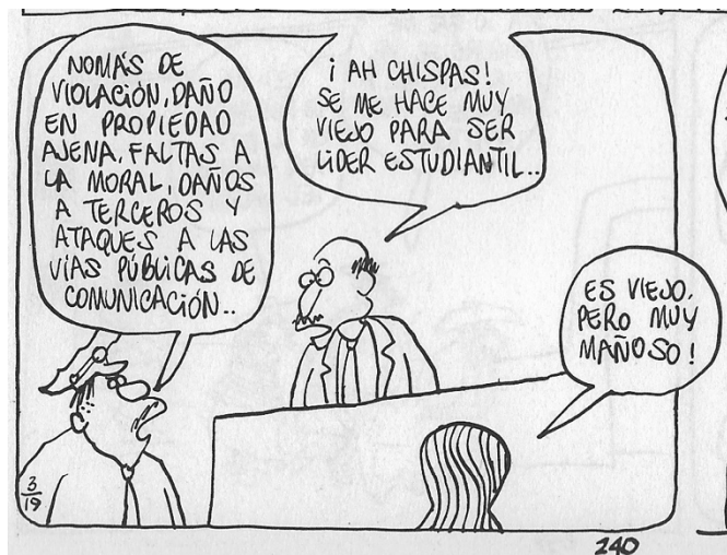
Figura 25. (19:240) cuadro 6

La primer crítica a Líderes estudiantiles está en la historieta 19, llevan a Don Ruco a la jefatura de policía, el juez le pregunta: “¿y de qué se le acusa, señor Rugama?”, el policía que lo detuvo le responde: “nomás de violación, daño en propiedad ajena, faltas a la moral, daños a terceros y ataques a las vías públicas de comunicación”, el juez enojado contesta: “¡ah chispas! se me hace muy viejo para ser líder estudiantil”, una vecina exclama: “es viejo pero muy mañoso 47 ”(19:240).