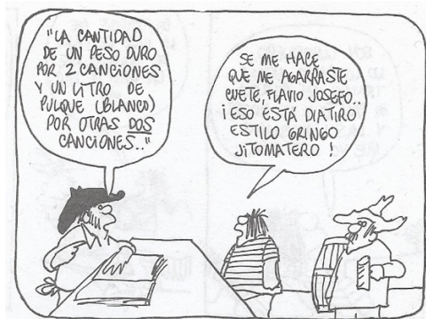
Figura 33. (24:44) cuadro 2

En esta crítica parece tocar un tema superficial, pero en realidad para la época Rius hace referencia César Chávez 54 activista mexicano que se manifestó en E.U. en conjunto con otros migrantes campesinos para exigir a los dueños de los terrenos, que su trabajo fuera bien remunerado, mejores condiciones laborales y se respetaran sus derechos humanos.