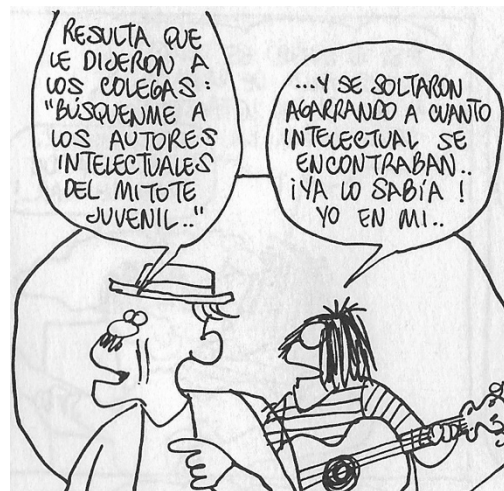
Figura 26. (24:47) cuadro 1

La sexta crítica la hallamos en la historieta 24, Don Flavio le pregunta a Bedoyo: "¿todavía anda buscando autores intelectuales?", Bedoyo responde: "ni me recuerde el asunto tan gacho, Don Flavio"(24:46), "resulta que le dijeron a los colegas: "búsquenme a los autores intelectuales del mitote juvenil..!" (24:47).