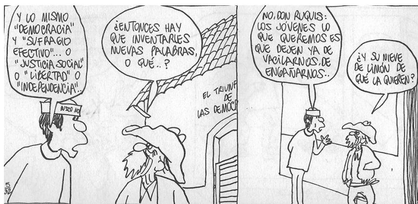
Figura 19. (32:114) cuadro 6 y 7

Rius nos muestra en estos diálogos el choque generacional y los ilustra con Don Ruco personaje en el que metaforiza a la gente adulta de la época, una generación que nació y vivió parte de su infancia la Revolución Mexicana, que vieron cómo se crearon algunas de las instituciones que hasta nuestros días siguen vigentes entre ellas el PRI, y que pensaban que la Revolución Mexicana les iba hacer justicia, otro punto que es importante destacar es que esta generación vivió un proceso en el que la gente de los pueblos migraba a las ciudades con la ilusión de que su estatus económico y social mejoraría. Y por otra parte estaban los jóvenes estaban en un momento coyuntural, el acceso a las universidades les permitió formar un pensamiento crítico, que no era tan fácil de engañar o apaciguar, influenciados por la cultura de la onda en la literatura, la libertad sexual, y la música subversiva de los 60s, nos dejó una generación que exige que se le escuchara y que nos dejaron como herencia la libertad de expresión y manifestarnos por aquello que nos molesta.