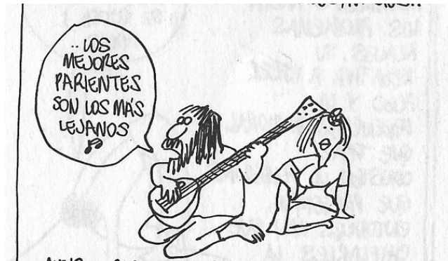
Figura 29. (32:67) cuadro 4

En la segunda crítica Rius es irónico, con la figura de los hippies, sobre todo por que representaba una generación de jóvenes que negaba su realidad política, mostraban vergüenza por su propia patria, esta movimiento represento un significativo choque de generaciones e ideales, en la cultura occidental, para Rius los ideales de los hippies no tenían un sustento ideológico y solo eran resultado de un modelo económico fallido.