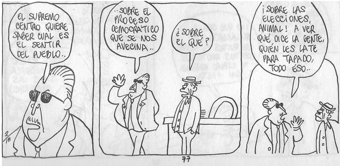
Figura 18. (18:77) cuadro 6, 7 y 8

La tercera crítica a elecciones, la situamos en la historieta 18 con Nopálin contestándole a Bedoyo Orejas: “ah andan otra vez con las mentadas elecciones, ya que lo dejen a uno mejor en paz”. Bedoyo insistente: “¿No le interesa quién salga presidente de su patria”, Nopálin: “pos viera que no mucho, si fuera el que decide, todavía, pero pos, uno es el último que se enterá”, interviene Don Bolívar “pos para eso precisamente leo el periódico, pa’ enterarme antes pús quien hay que votar” (18:82). Nopálin en un tono irónico contesta: “ah vaya: yo creía que usted votaba por el que le daba su gana”, Don Bolívar: “¿y qué gano, si no va a salir? mejor voto a lo seguro”.