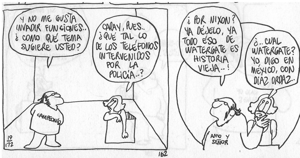
Figura 21. (172:162) cuadro 6 y 7

La historia se desenvuelve con dos personajes: un editor y el escritor Recaredo, ambos discuten diferentes temas entre ellos el de teléfonos intervenidos. La crítica inicia cuando el editor le pregunta: “¿cómo qué tema sugiere usted?”. Le contestó pensativo Recaredo: “caray, pues ¿qué tal lo de los teléfonos intervenidos por la policía?”. El editor: “¿por Nixon? ya déjalo, ya todo eso de watergate 38 es historia vieja”. El escritor refuta: “¿cuál watergate?, yo digo en México con Díaz Ordaz” (172:162).