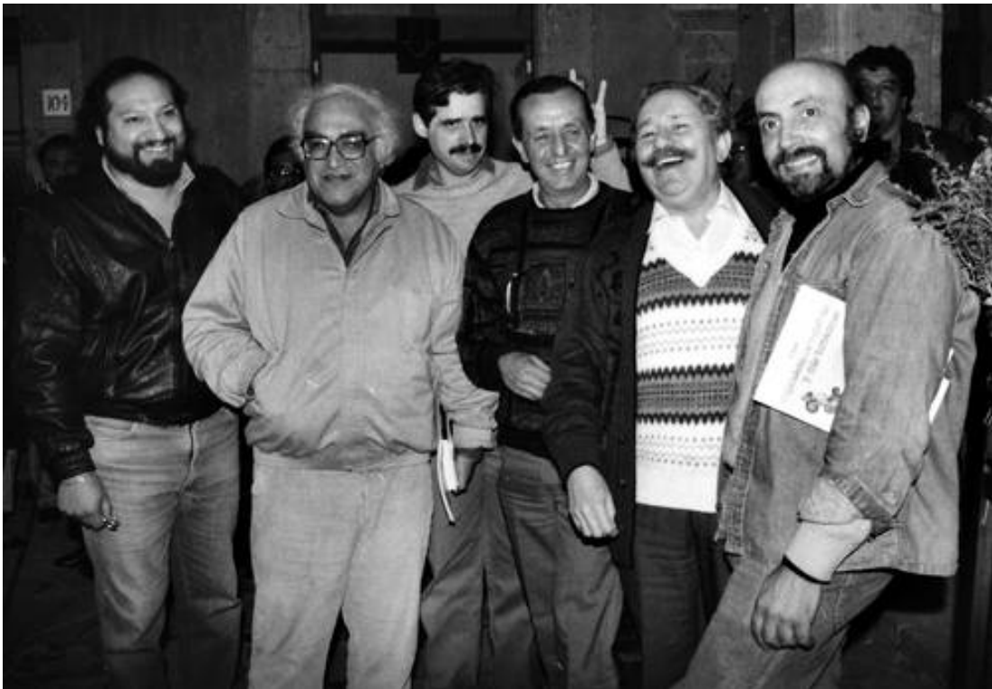
El caricaturista Kemchs ; Carlos Monsiváis; Rafael Barajas, El Fisgón ; Eduardo del Río, Rius ; Paco Ignacio Taibo I, y Bulmaro Castellanos, Magú , en 1991

Rius falleció el martes 8 agosto del 2017, en Tepoztlán Morelos.