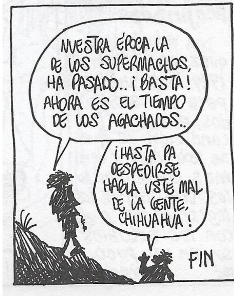
Figura 4. (2:39) cuadro 8

coco!”, Chon: cruzado de manos rebate “¿a poco semos un pueblo de tapados?”, finalmente Calzónzin: “pos al menos así nos tratan” (02:12).