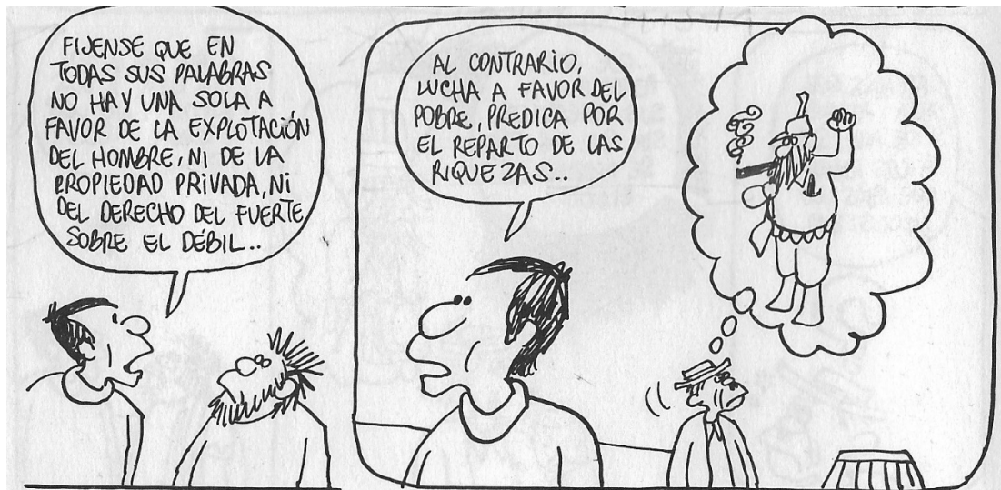
Figura 13. (18:102) cuadro 3 y 4

La séptima crítica Don Cusco y Don Filipino están platicando en las oficinas del RIP Don Cusco: le pregunta “¿dónde vamos a sacar otro Tata Vasco 29 a