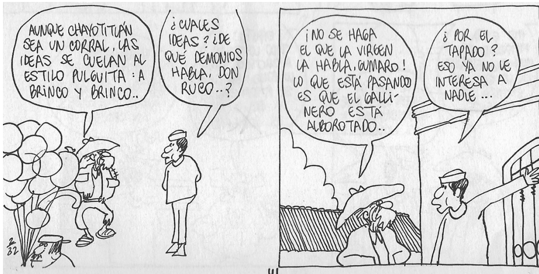
Figura 16. (32:111) cuadro 6 y 7

gallinero está alborotado”. Gumaro: “¿por el tapado? eso ya no le interesa a nadie” (32:111). Gumaro contesta cruzado de manos: “el tapado, la democracia, las elecciones, la justicia chochal ¿a quién le interesa ya todo eso?”. Don Ruco: “¿y por qué ya no les interesa? les debería interesar, ¿no cree?” (32:112).