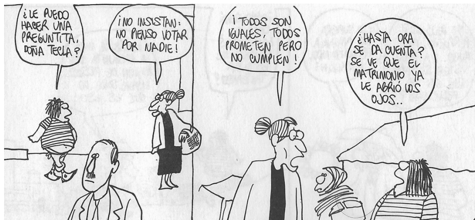
Figura 17. (16:174) cuadro 1 y 2

En la primera crítica a elecciones Nopálzin le pregunta a Doña Tecla 32 “¿le puedo hacer una preguntita, Doña Tecla?”, Doña Tecla molesta le contesta: “¡no insista no pienso votar por nadie!, ¡todos son iguales, todos prometen pero no cumplen!”, rebate Nopálzin: “¿hasta ora se da cuenta?” (16:174).