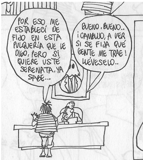
Figura 23. (23:53) cuadro 4

La crítica a hippies habla de represión a los jóvenes, en los años sesenta hubo fuertes movimientos migratorios de los pueblos a las ciudades, en la búsqueda de oportunidades, se encontraron con pobreza, desigualdad y falta de empleo. Nopálzin con su guitarra vieja, su ropa desgatada refleja la crisis que vivía el país. En búsqueda de trabajo, pero sin aspiraciones, viviendo el día a día, los jóvenes sufrían discriminación por su vestimenta y condición económica confundidos con los hippies por un gobierno que persiguió a sus opositores y a todos los que alzaban la voz para exigir mejores condiciones; sociales, económicas y políticas.