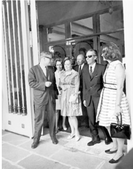
El presidente Díaz Ordaz y el Rockefeller y respectivas esposas en la puerta de la Residencia de Los Pinos.