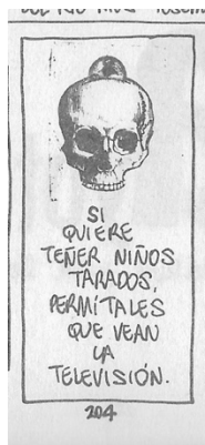
Figura 32. (39:204) cuadro 4

La tercera crítica a tv está la historieta 39, en la sección de avisos oportunos. Está compuesta de la crítica iconográfica ilustrando una calavera y en la parte de abajo está la crítica textual que dice: “si quiere tener niños tarados permítase que vean la televisión” (39:204).