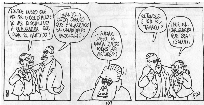
Figura 14. (18:107) cuadro 6, 7 y 8

“vamos, Don Filipino: ¡no dramatice tanto! últimamente, ni usted ni yo somos los exigentes ¿verdad?”, Don Cusco: “desde luego que no Sr. licenciado yo me disciplino al partido a cualquiera que diga el partido!”, abraza Don Filipino y se ríe contestando “igual yo, y estoy seguro que hallaremos el candidato necesario”, “aunque luego le inventemos todas las virtudes”. Señala nervioso, finalmente los dos se abrazan y brindan “entonces ¿por el tapado?”, Don Filipino: “¡por cualquiera que sea! ¿salud?” (18:107). Lo cual reitera la costumbre de disciplinarse a las decisiones del partido tomadas por unos cuantos.