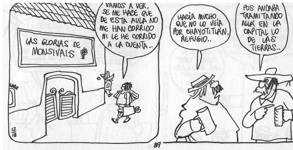
Figura 7. (18:87) cuadros 6 y 7

La crítica inicia con en el nombre de una pulquería. En la interpretación podemos pensar que agregar “ Las Glorias de Monsiváis ” puede hacer referencia a los libros de Monsiváis que fueron un éxito en ventas, puesto que Monsiváis abundó en exponer la realidad. Rius trae a colación a una minoría en la historieta, los campesinos molestos, escépticos de que las cosas mejoren y cansados por falta de oportunidades. En el diálogo entre Don Céforo y Don Cuco rescatamos dos puntos: uno es que parecía ser que el cambio en la vida política, económica y social solo se daba cada seis años con el cambio de presidente, y dos que entre la gente había un agotamiento y desilusión hacia los políticos, al no ser aptos en la toma de decisiones, repercuten en la vida de los mexicanos.