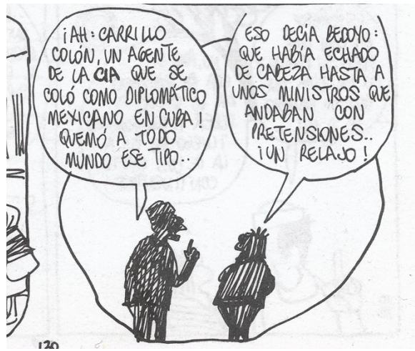
Figura 34. (23:130) cuadro 7

En esta crítica se aborda un tema polemico, un diplomático mexicano acreditado en La Habana era agente de la CIA, se creo que Gustavo Díaz Ordaz no tenia conocimiento de esta misión. Fue hasta que se le entrego una denuncia al entonces secretario de relaciones exteriores Carrillo Flores.