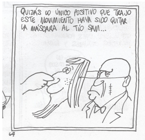
Figura 27. (24:64) cuadro 6

En el siguiente cuadro el monero dibuja un gran signo de dólar con un cráneo arriba y un perro orinando, “porque lo primero que gritan los hippies gringos 49 es sus vergüenza de ser gringos, policías del mundo y explotadores del pueblo”, refuerza la crítica con un gran muro grafitado por un hippie con una gran frase: “yankees 50 no” (32:65).