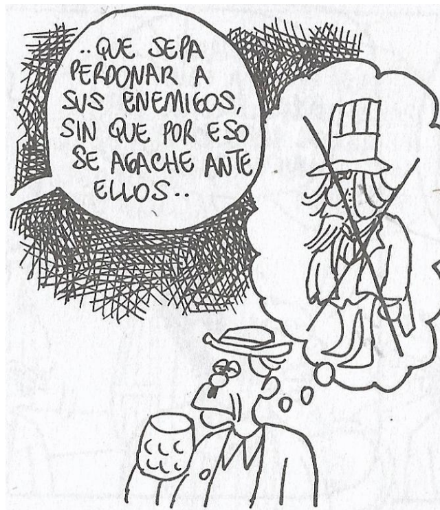
Figura 9. (18:101) cuadro 4