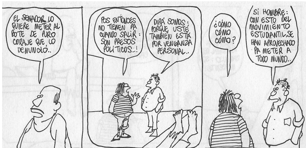
Figura 24. (16: 182) cuadro 1, 2 y 3

Nopáizin menciona repetidas veces que es inocente, Rius crítica de forma indirecta en el diálogo de uno de los personajes contestando: “¡no sé por qué las cárceles están llenas de inocentes!”, el sistema de justicia era un institución de poco respeto, ya que se condenaba a muchas personas sin investigación previa, esto permitía que se prestara a casos de corrupción, gente culpable que pagaba sobornos para ser liberada o gente inocente que metían por venganzas personales, Rius sigue nutriendo la crítica con otro argumento de forma indirecta: “¡entonces te traía ganas alguien o eres rojillo? o ¿eres estudiante?”, y es que en el fondo de estas líneas están los casos de represión a los estudiantes del 68 por parte del gobierno, al grado de meterlos a cárcel, como el caso de los 43 consignados a Lecumberri por disturbios el 26 de julio de 1968.