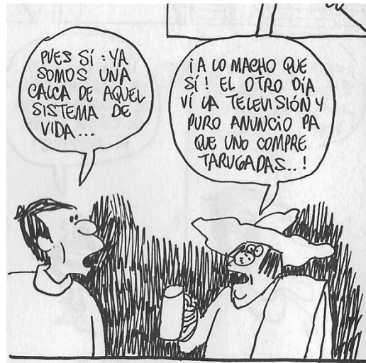
Figura 31. (24:70) cuadro 5

Rius crítica indirectamente el sistema económico capitalista que promueve el consumismo como sistema de vida. Señala que México se estaba convirtiendo en una copia de Estados Unidos, uno de los personajes reafirma contestando: "en la televisión difunden puras tonterías". El Monero menciona como hay una construcción social del rol de hombre por medio de spots, ya que en los comerciales se dice que para ser perseguido por las mujeres tiene que "tomar ron", "usar desodorante" y "fumar cigarros". Rius señala que con el consumir todos estos productos hacen creer que la gente se vuelve exitosa, sin importar el crecimiento intelectual. Nopálzin dice que él ignora los comerciales, pero en estos spots ponen mujeres semidesnudas y rubias. Esto se interpreta como la difusión de un estereotipo de la mujer americana.