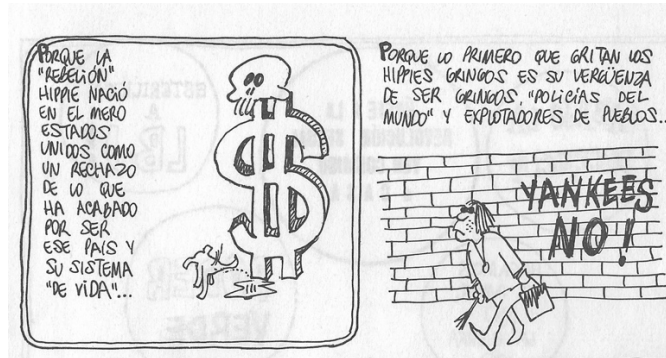
Figura 28. (32:65) cuadro 1 y 2

Los hippies surgieron a raíz de jóvenes que se dieron cuenta, que la guerra no beneficiaba a todos, aumentaba la desigualdad y la violencia, cada vez había más bajas de jóvenes, aquellos conflictos carecían de una justificación social, además de que parte de los recursos eran designados en armamento, en lugar de destinarlos en otras cosas, como escuelas, hospitales o universidades.