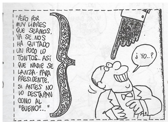
Figura 3. (2:11) cuadro 2

En la parte superior mediante una explicación alude a los contenidos constitucionales sobre los derechos de votar y ser votados y de ser candidato presidencial; “en teoría todo el país: todo ciudadano en edad apropiada puede ser presidente” (02:10). En el siguiente cuadro aparece un hombre con un cartel, con su cara que dice: “Pérez vote por él” (02:11), a un costado “y todos pueden presentar su candidatura para la presidencia, ¡somos un país libre!”; textualmente “pero por muy libres que seamos ya se nos ha quitado un poco lo tontos, así que nadie se lanza para presidente, si antes no lo destapan como al bueno” (02:11).